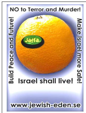
Peace-Badge Israel no.2B