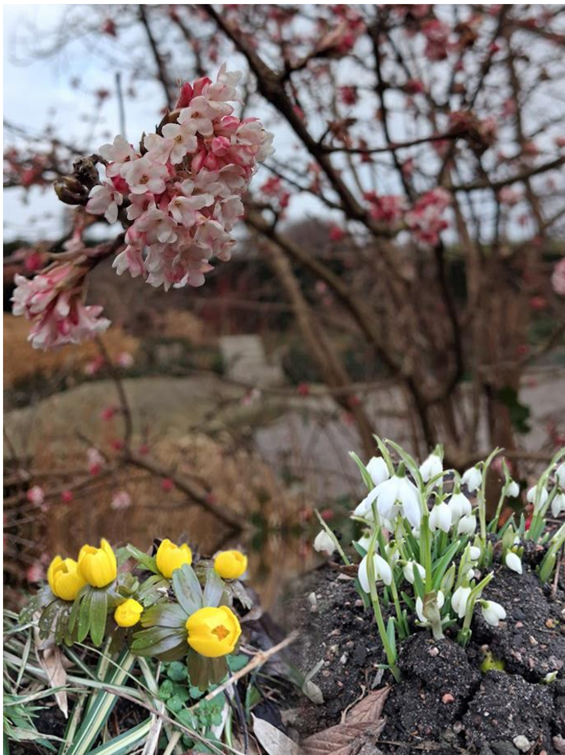
Slottsträdgården Malmö vår 2026

EDEN önskar en skön vår 2026, fred för Israel!