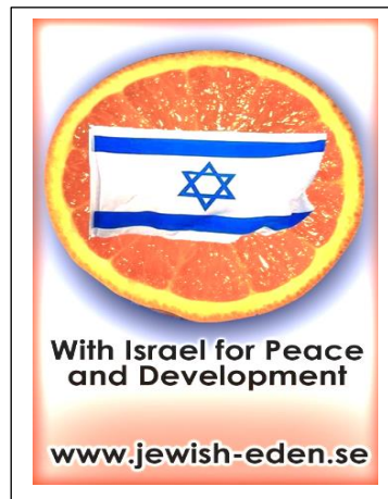
Peace-Badge Israel no.1B