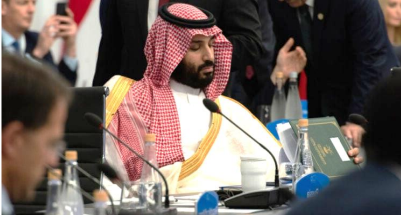
Saudiarabiens kronprins Mohammad bin Salmán