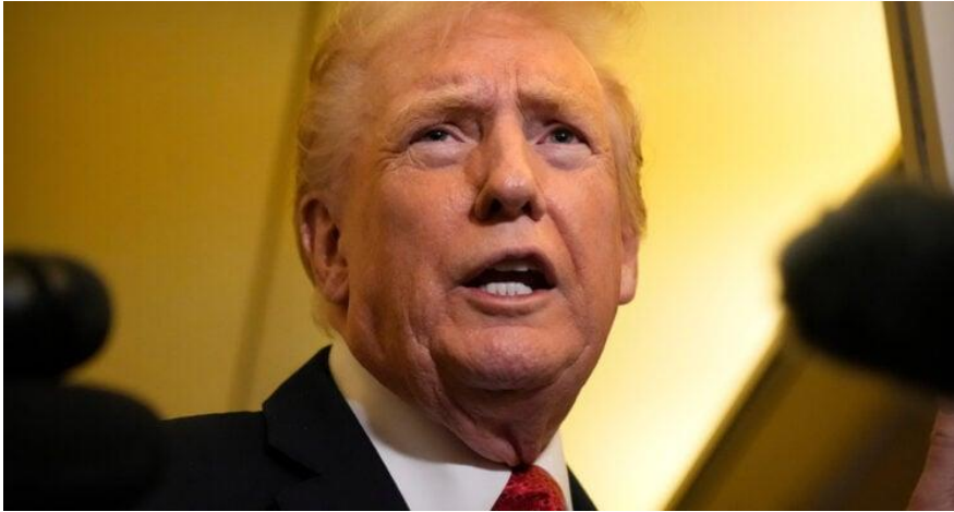
President Donald Trump

President Trump warns the US will hit Iran “with a force that has never been seen before” if Tehran follows through on its threats to ramp up its strikes on US allies.