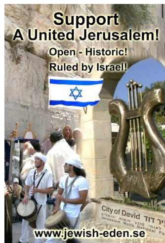
Peace-Badge Israel no.4

Support A United Jerusalem! Open - Historic! Ruled by Israel!