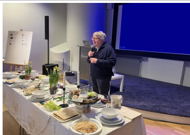
EDEN- Judisk Påsk i Malmö Museum

We can only hope that the Iranian people will be able to put an end to it once and for all, which they will be able to do if enough of the Islamic regime's forces realize that the writing is on the wall and that it is time for them to stop making war against their own people. May that day come — today.