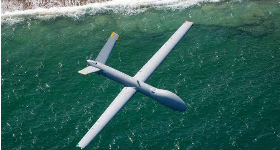
Elbit Systems obemannade flygfarkost Hermes 900. (Elbit)